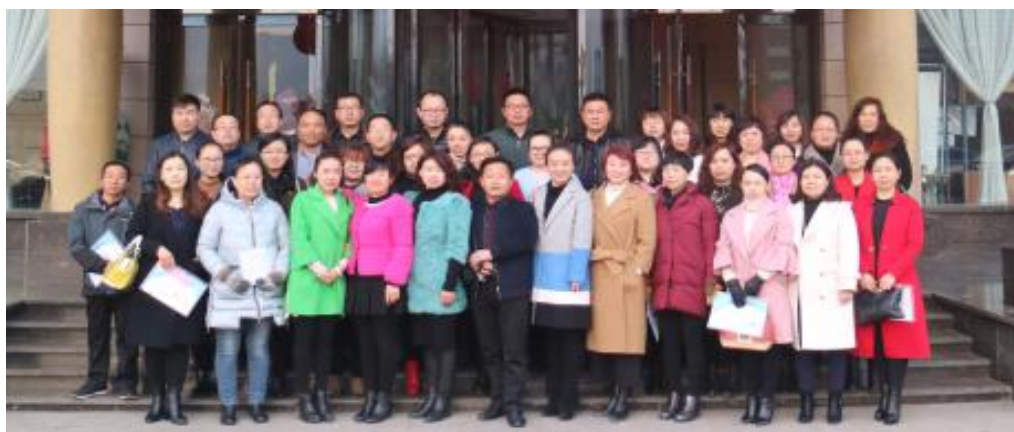
部分工作坊坊员合影